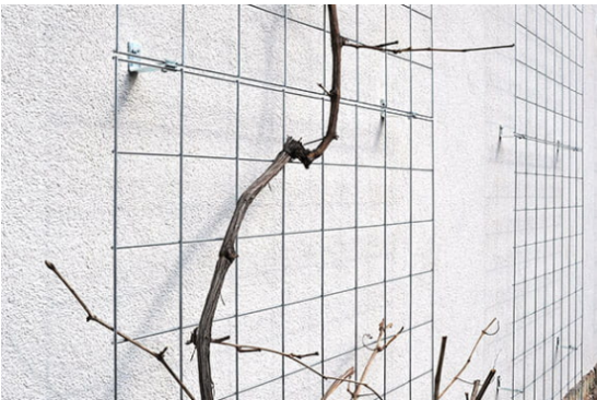
PRZYKŁAD MOCOWANIA TYPU "L" KRATKI DO ŚCIANY-ŁĄCZENIE KOLEJNYCH PÓŁ KRATY

PROJEKTOWANE ZMIANY W ZAKRESIE PROJEKTU KONCEPCYJNEGO