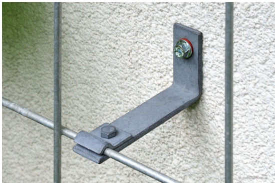
PRZYKŁAD MOCOWANIA TYPU "L" KRATKI DO ŚCIANY